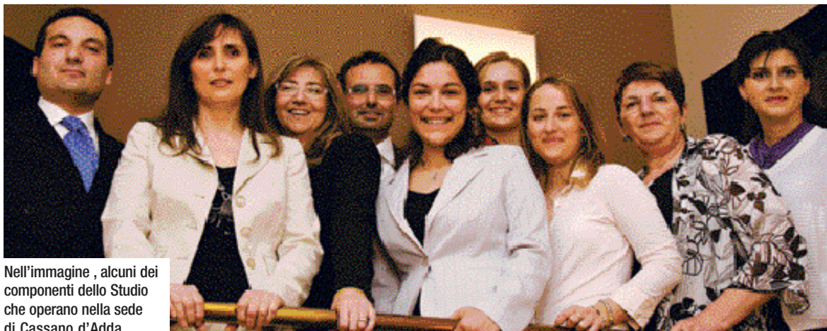
Nell'immagine, alcuni dei componenti dello Studio che operano nella sede di Cassano d'Adda

Professionalità, dinamicità ed affidabilità: ovvero Batini Colombo Saottini Dottori Commercialisti & Avvocati. Un team di professionisti al servizio delle imprese