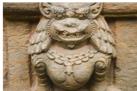
Antica raffigurazione Nepalese della Tigre

Al riguardo, le nuove regole potrebbero quindi considerarsi già applicabili con riferimento al periodo d'imposta 2009, ma sul punto appare necessaria una conferma dell'Agenzia delle Entrate, anche in considerazione di quanto verrà previsto nei modelli UNICO 2010 in corso di approvazione.